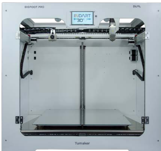
Abbildung BIGFOOT DUAL – Bowden-/Pelletextruder